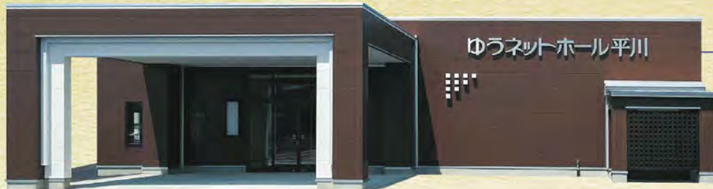
ゆうネットホール平川

西谷造花店では、黒石市の駅前に「メモリアルホールにしや」、平川市小和森に「ゆうネットホール平川」と2つのホールを有しております。ご予算、ご要望に合わせてお選び頂けます。