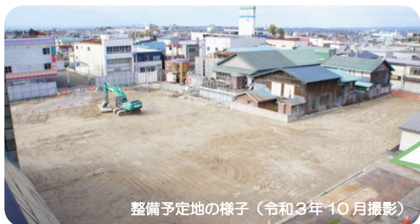
整備予定地の様子 (令和3年10月撮影)

市では、平成17年の閉店以降、空き店舗となっていた旧大黒デパート跡地に(仮称)市民サービス施設の建設を計画しており、市民の皆さまと一緒に考え、つくっていくため、アンケートやワークショップ等を実施しながら検討を進めています。