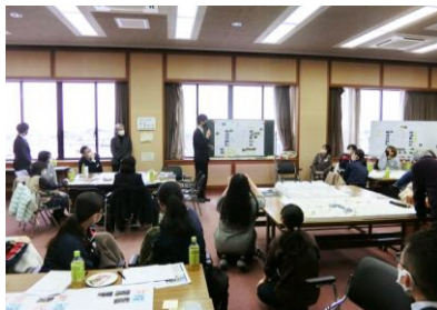
グループごとに意見交換・発表

第2回目を令和3年12月19日(日)に開催し、市内にお住まいの子育て世代、高校生、まちそだてに取り組んでいる団体の方などにご参加いただきました！