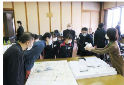
まちなかや施設の模型も使いながらイメージを共有