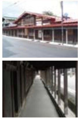
黒石市都市計画マスタープラン