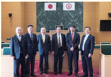
兵庫県小野市の視察の様子

いずれも興味深いものばかりであり、どのようにすれば黒石市でもうまく活用できるかを考えていきたいと思ひます。