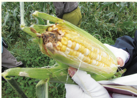
廃棄予定のトウモロコシ

高温被害により、白菜、キャベツは芯が腐ってしまい出荷ができなくなり廃棄したこと、また、大根は変形し、レタスやトウモロコシも品質が低下し出荷できない状況を確認しました。