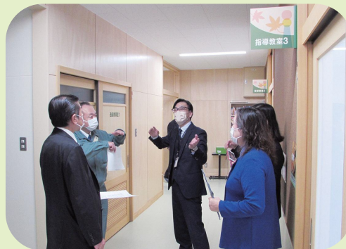
黒石小学校視察の様子

給食は子どもたちにも保護者の皆さんにも好評を得ているとのこと、今後の中学校給食の検討にも役立てていただきたいと思います。