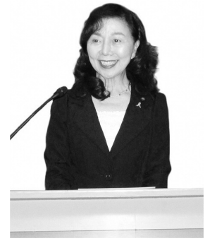
黒石ナナ子 議員 新自民・公明クラブ