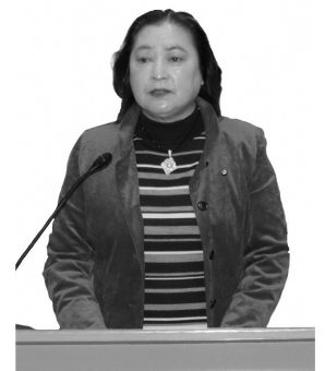
工藤 禎子 議員 日本共産党

その他の質問 ・いじめ・不登校・自殺について ・教育のSDGsの対応について ・伝統芸能の保存、後継者育成について