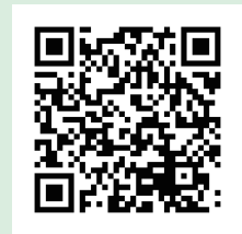
黒石市議会 YouTube ホームページ