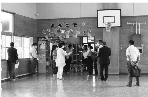
東児童センター視察の様子

当委員会で、様々な意見を踏まえ、利用する児童の安全を第一に考えながら今後の活動を進めていきます。