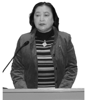
工藤 禎子 議員 日本共産党