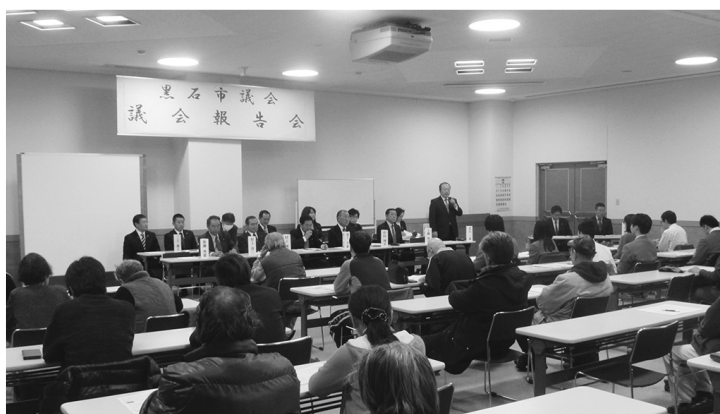
多数の御参加お待ちしております

内容：平成30年第1、2回定例会の報告 主な審議議案について 平成30年度予算について 自由意見交換