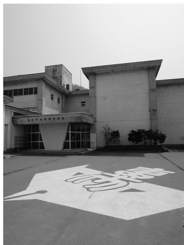
閉校した東英中学校と駐車場に記念として描いた校章