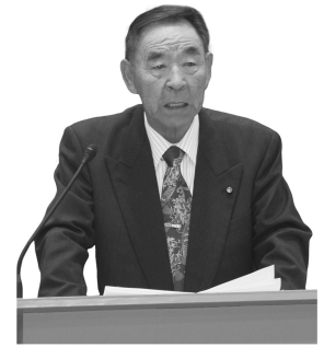
村上 啓二 議員 自民・公明クラブ