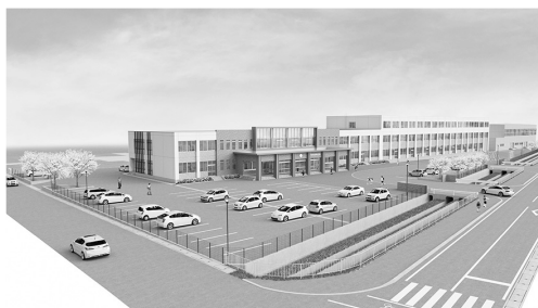
新設黒石小学校完成予想図

答 検討委員会で事業発注の方向を決定し入札を行い、9月議会で承認を頂ければ新築工事の着工をし、平成32年3月完成となります。