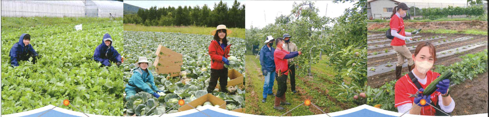
🍆 だいこん収穫作業中