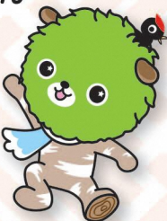
ブナッキー (西目屋村)