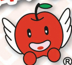
ふじ丸くん (藤崎町)