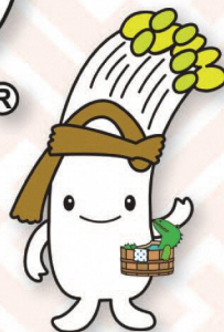
もやっぴー (大鰐町)