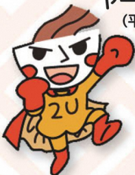
つゆヤキソバン (黒石市)