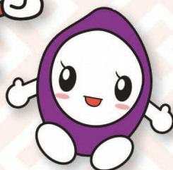
米こめくん (田舎館村)