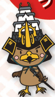
たか丸くん (弘前市)