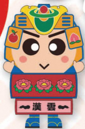
ヤーヤくん (平川市)