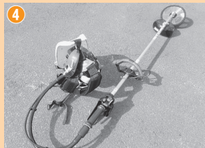
①除雪作業の負担が軽くなる除雪機 ②「幻の県道ハイキング」の文字が入ったウインドブレーカー ③携帯型トランシーバー ④地域内の環境整備に使用される背負い刈り払い機