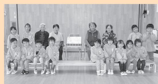
中郷こども園にぞうきんを100枚贈呈