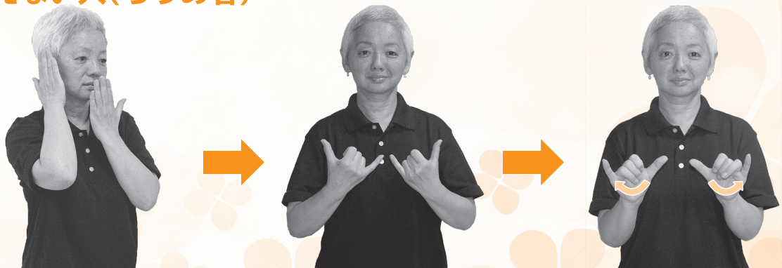
耳と口に手のひらを当てる