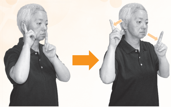
耳と口に人さし指を当て、それぞれ離す(2回)