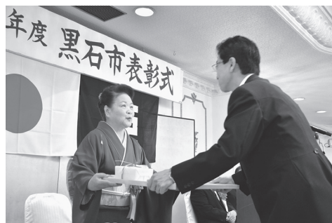
昨年度の表彰式の様子