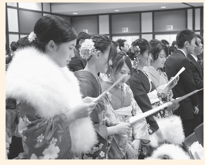
昨年度の式典の様子

市は、令和元年度「成人式」を、スポカルイン黒石で次のとおり開催します。 本市に住民登録をしている人には、12月上旬に案内状を発送します。住民登録をしていない人も参加できますので、詳しくは市ホームページをごらんになるか、お問い合わせください。 ◆日時：2年1月12日(日)▽受付開始11時▽オープニング11時45分▽式典11時55分▽記念写真撮影12時25分 ◆会場：スポカルイン黒石メインアリーナ ◆対象者：平成11年4月2日から12年4月1日までに生まれた人 ◎記念写真の購入希望者は、当日会場で撮影業者に直接申し込みください(郵送料込みで1枚1000円)。 発表者を募集 式典で「二十歳の決意」と「新成人を激励する言葉」を