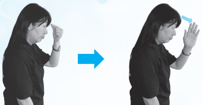
親指と人さし指で眉間をつまむ