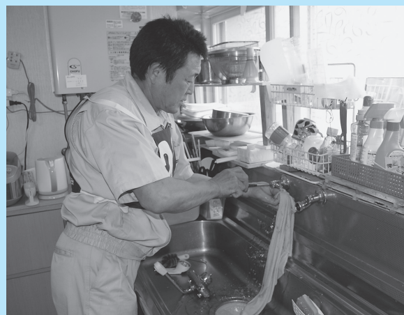
蛇口を点検し、水漏れを修繕する組合員

このボランティアも今年で22回目。この活動が少しずつ地域に定着していくことが「誇れる故郷、黒石」の形成へつながります。